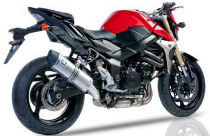
SUZUKI GSR 750