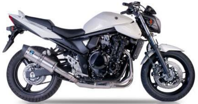
SUZUKI GSF 650 BANDIT