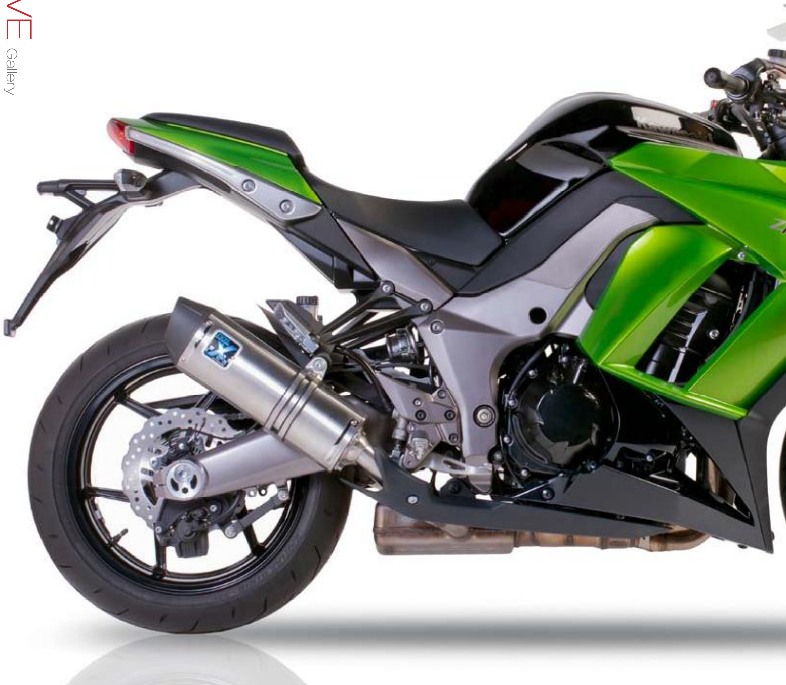
KAWASAKI Z 1000 SX