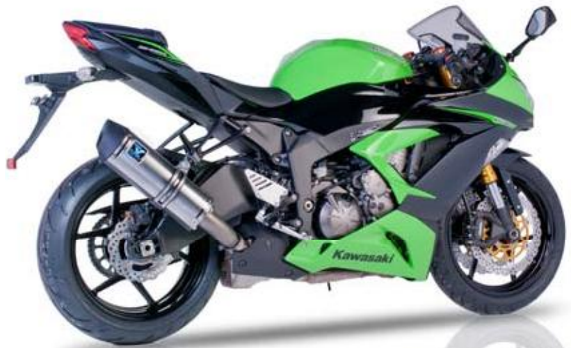
KAWASAKI ZX 636 '13