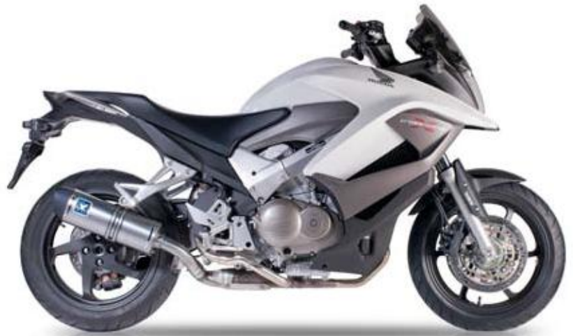
HONDA CROSSRUNNER 800