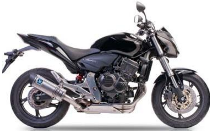
HONDA CB 600 F HORNET