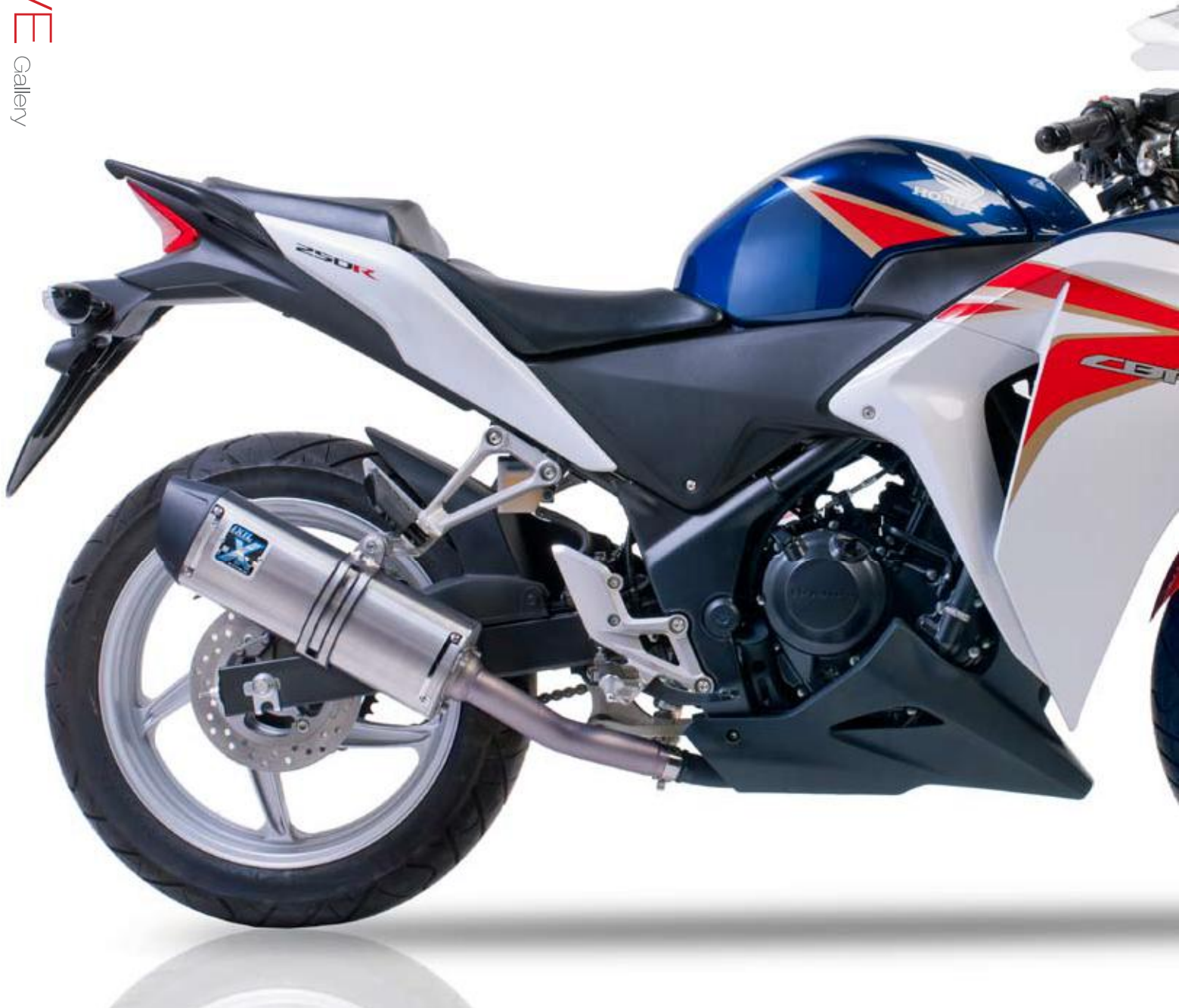
HONDA CBR 250 R 12