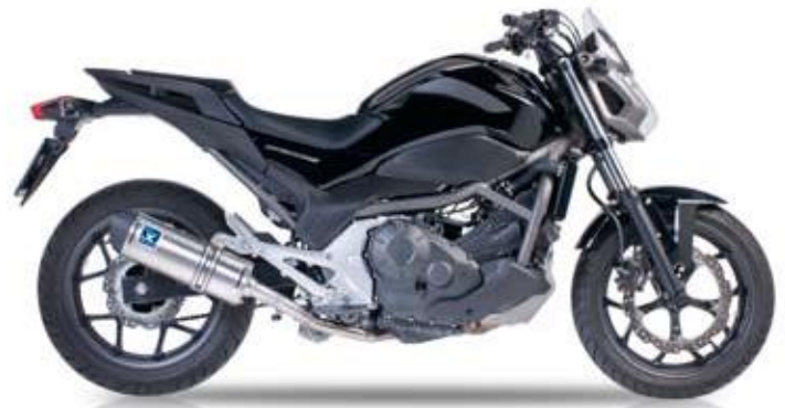
HONDA NC 700 S