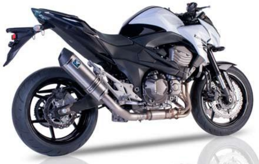
KAWASAKI Z 800