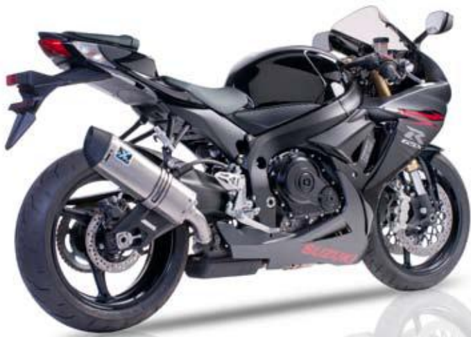
SUZUKI GSXR 600-750 11-13