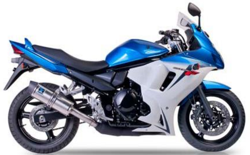
SUZUKI GSX 650 F