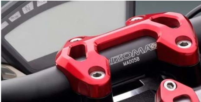
Lenkerhalter, Ausführung AZ200