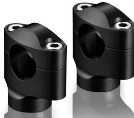
Lenkerhalter, Ausführung AZ402