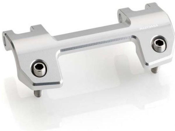
Lenkerhalter, Ausführung AZ310