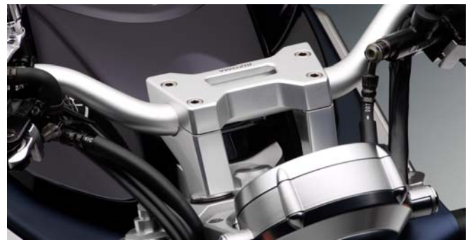
Lenkerhalter, Ausführung AZ110