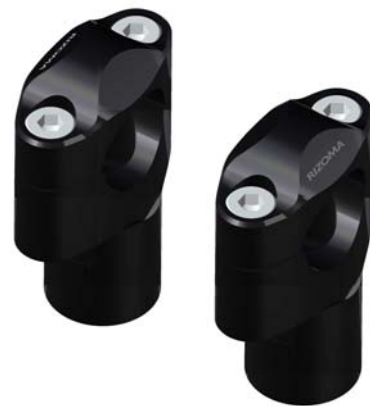
Lenkerhalter, Ausführung AZ403