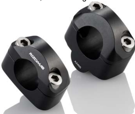
Lenkerhalter, Ausführung AZ405