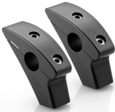
Lenkerhalter, Ausführung AZ019/AZ020