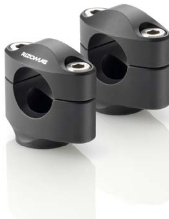
Lenkerhalter, Ausführung AZ432