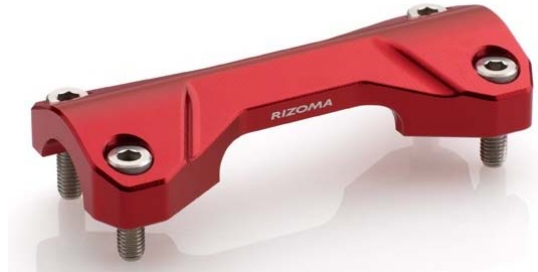
Lenkerhalter, Ausführung AZ201