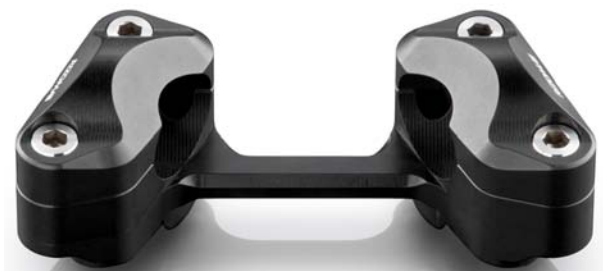
Lenkerhalter, Ausführung AZ600