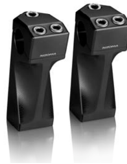
Lenkerhalter, Ausführung AZ014/AZ016/AZ018