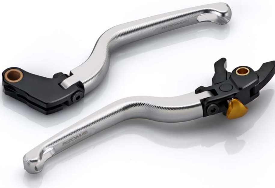
Rizoma Austauschhandhebel, Typ RZ Ausführung LB u.LC