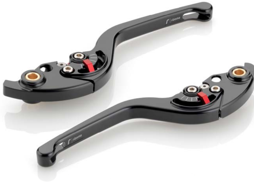
Rizoma Austauschhandhebel, Typ RZ Ausführung LBR u.LCR