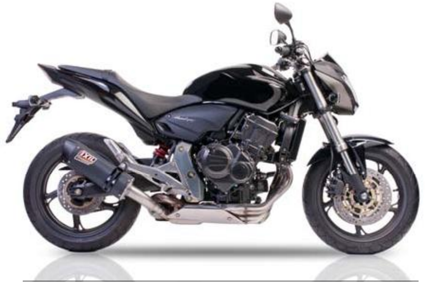
HONDA CB 600 F HORNET