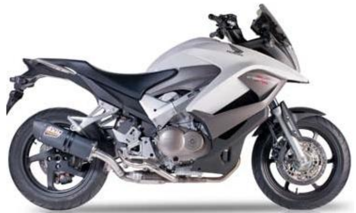
HONDA VFR 800X CROSSRUNNER