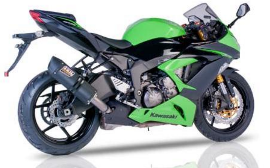
KAWASAKI ZX636 13