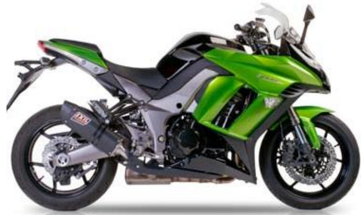
KAWASAKI Z1000 SX