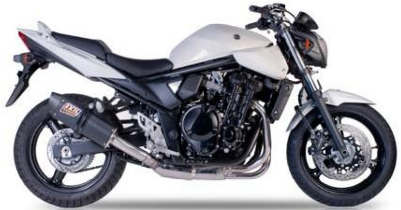
SUZUKI GSF 650 BANDIT