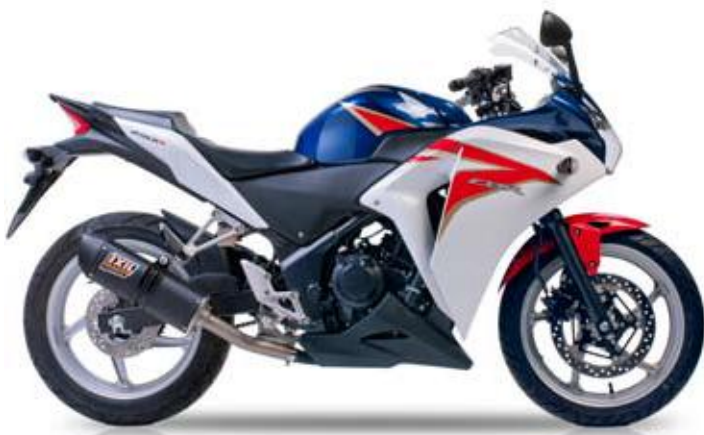
HONDA CBR 250 R '12