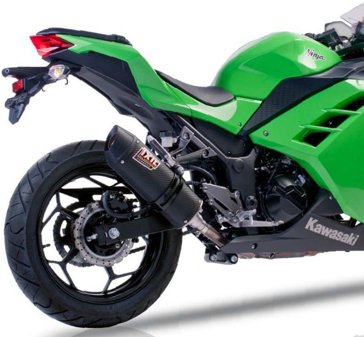
KAWASAKI NINJA 250-300 '13