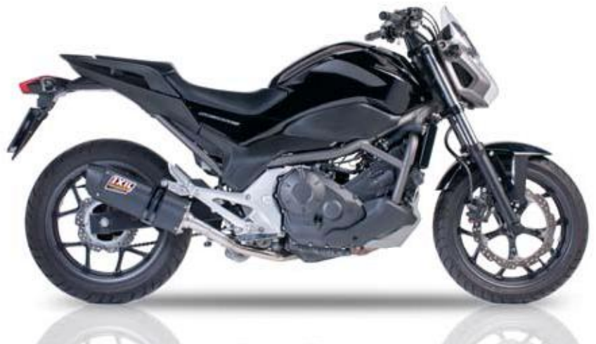
HONDA NC 700 S