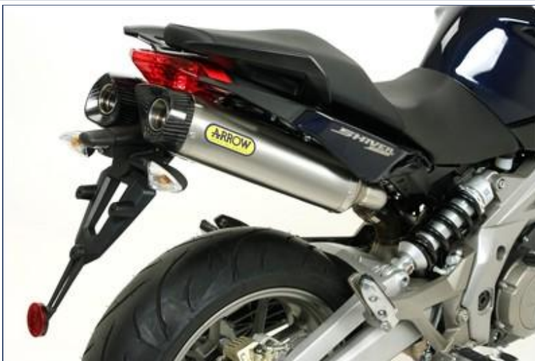
Terminali Thunder titanio con fondello carby