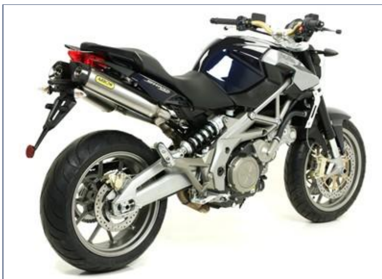
Terminali Thunder titanio con fondello carbby