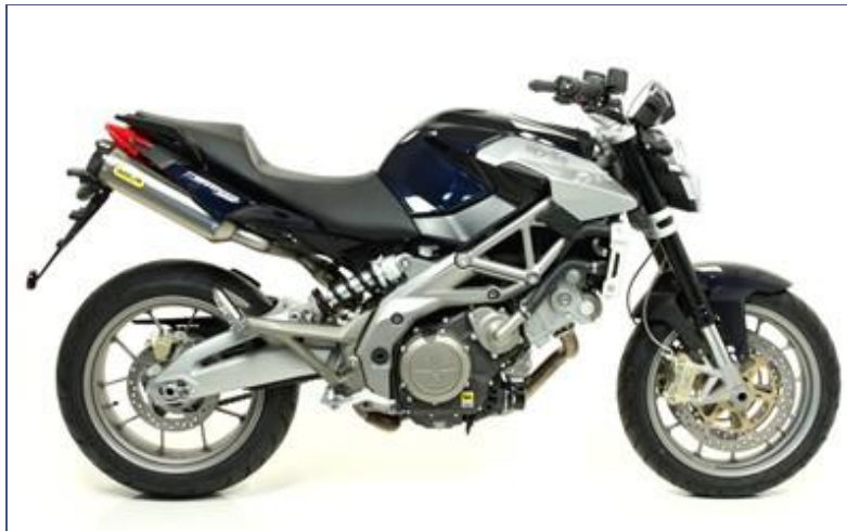
Terminali Thunder titanio con fondello carbby