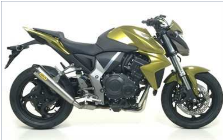
Terminale Pro-Racing con fondello carby + raccordo no kat