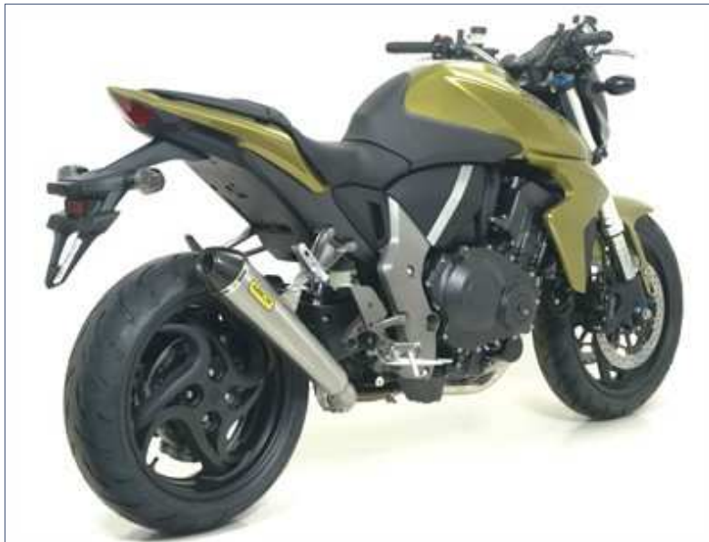
Terminale Pro-Racing con fondello carby + raccordo no kat