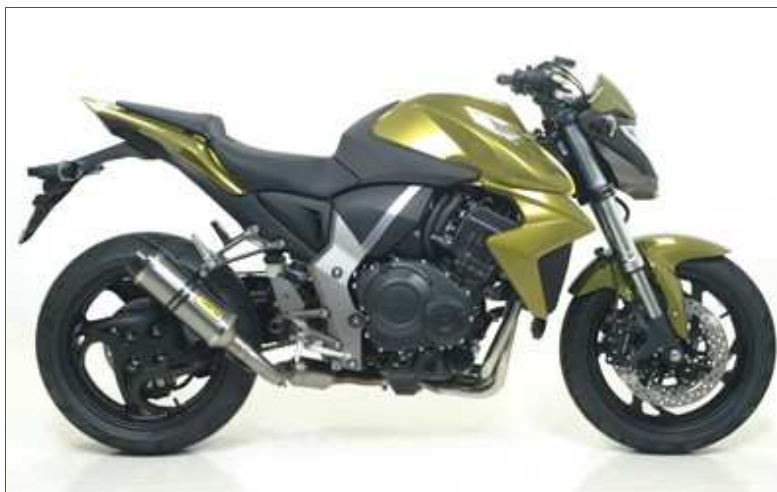
Terminale Street Thunder con fondello carby + raccordo no kat