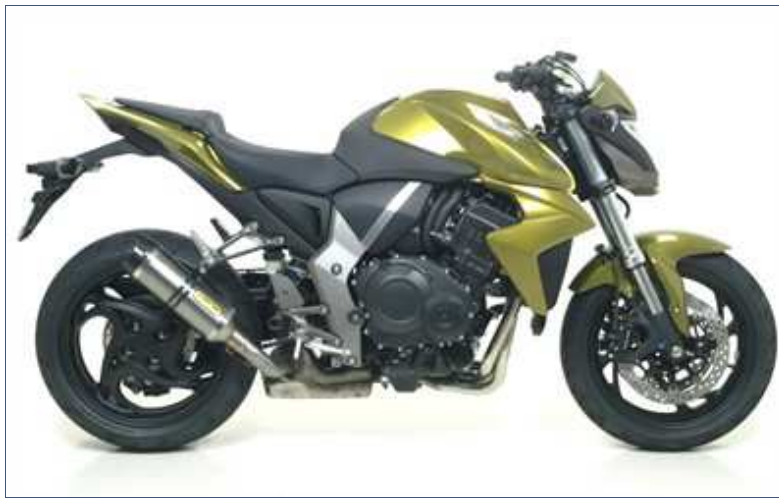
Terminale Street Thunder con fondello carby