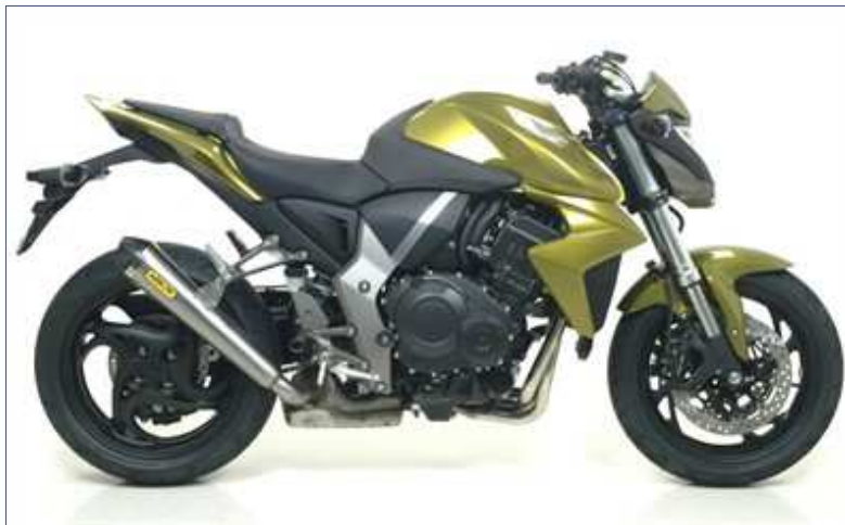
Terminale Pro-Racing con fondello carby