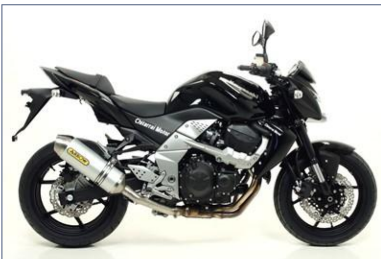
Terminale Race-Tech Approved alluminio