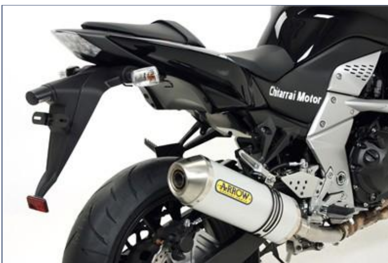
Terminale Race-Tech Approved alluminio