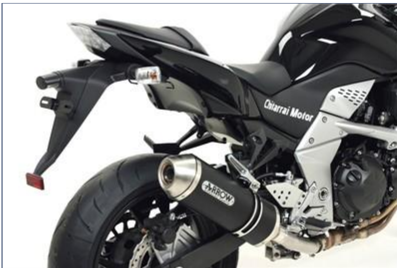
Terminale Race-Tech Approved aluminum "Dark"