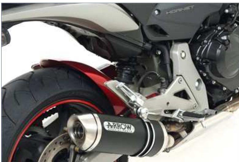
Terminale Street Thunder aluminium "Dark"