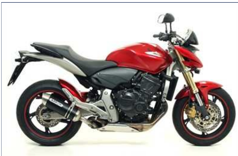
Terminale Street Thunder aluminium "Dark"