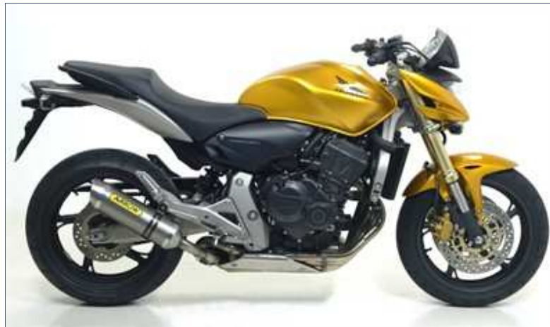
Kit terminale Thunder