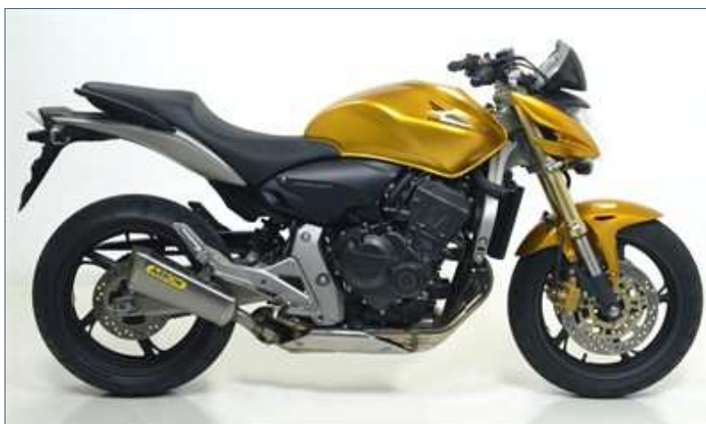
Kit terminale Pro-Replica