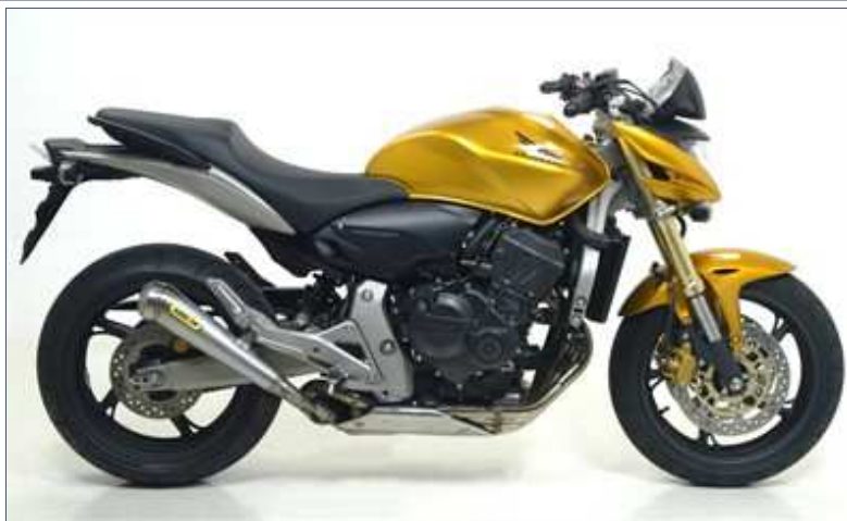
Kit terminale Pro-Race