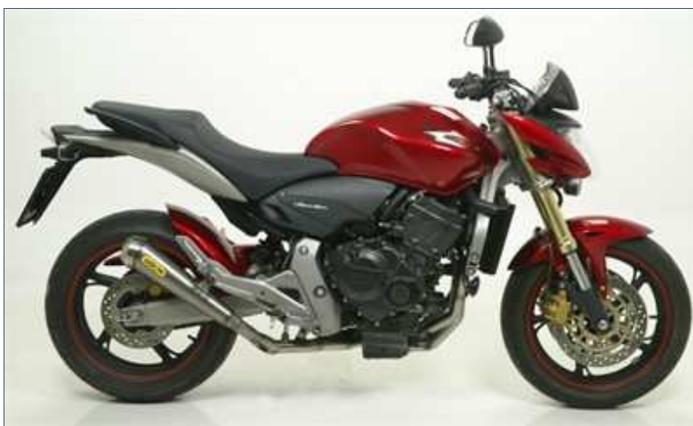
Kit completo Pro-Race