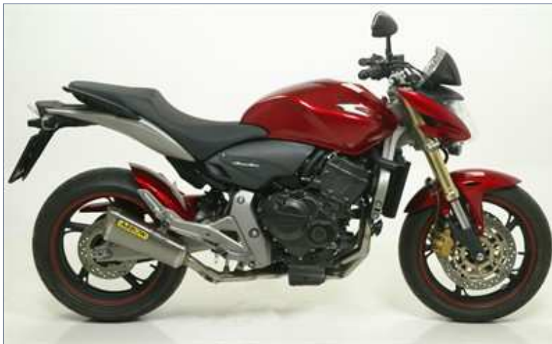
Kit completo Trophy