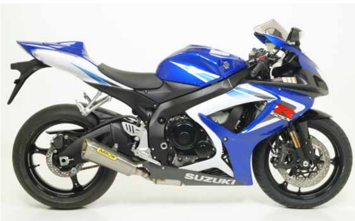
EUROPEAN CUP REPLICA