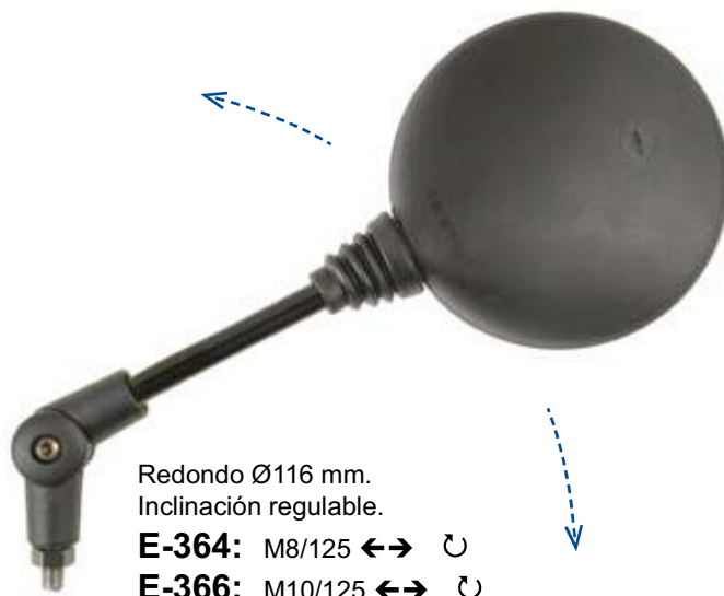
Redondo Ø116 mm. Inclinación regulable. E-364: M8/125 ←→ ↻ E-366: M10/125 ←→ ↻