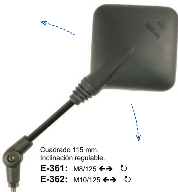
Cuadrado 115 mm. Inclinación regulable. E-361: M8/125 ←→ ↻ E-362: M10/125 ←→ ↻