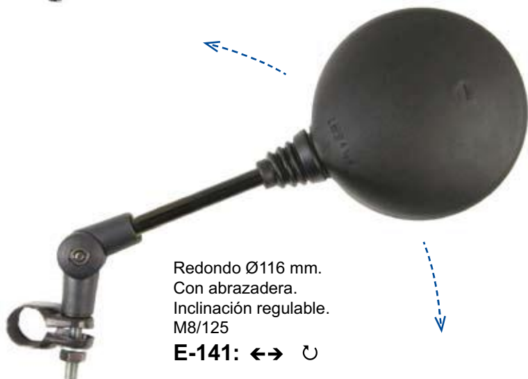
Redondo Ø116 mm. Con abrazadera. Inclinación regulable. M8/125 E-141: ←→ ↻