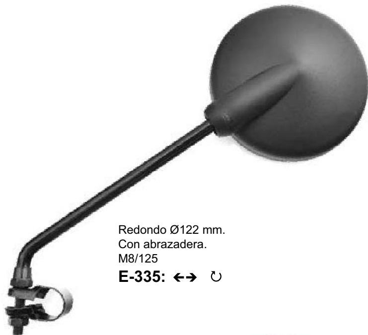
Redondo Ø122 mm. Con abrazadera. M8/125 E-335: ←→ ↻