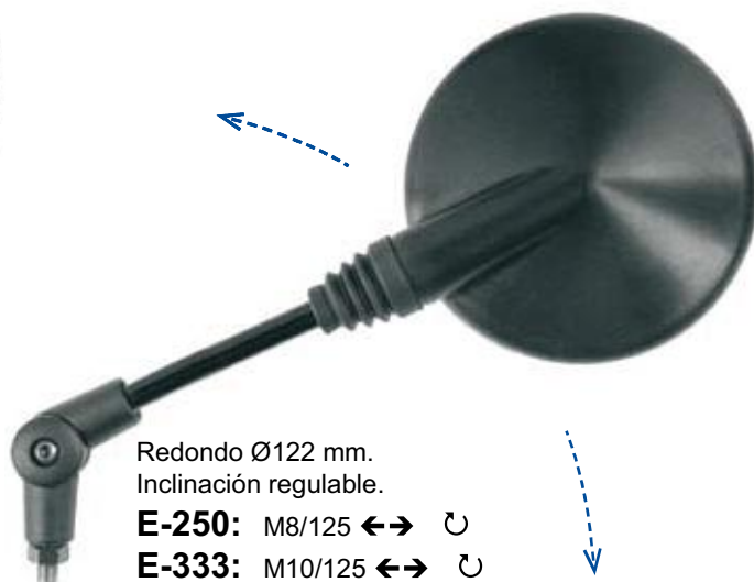
Redondo Ø122 mm. Inclinación regulable. E-250: M8/125 ←→ ↻ E-333: M10/125 ←→ ↻